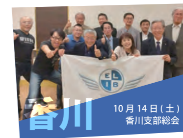
10月14日（土） 香川支部総会