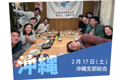
2月17日（土） 沖縄支部総会