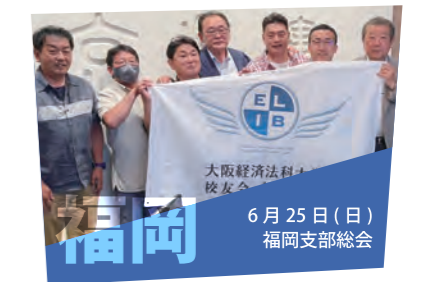
6月25日（日） 福岡支部総会