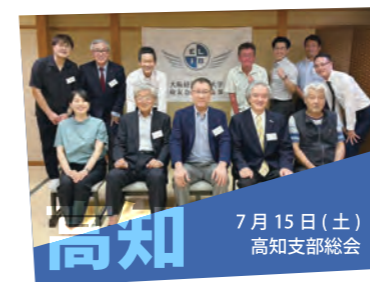
7月15日（土） 高知支部総会