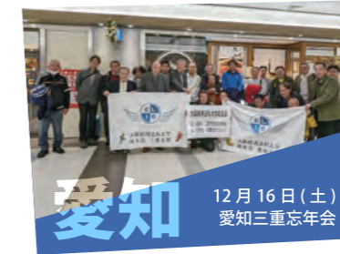
12月16日（土） 愛知三重忘年会