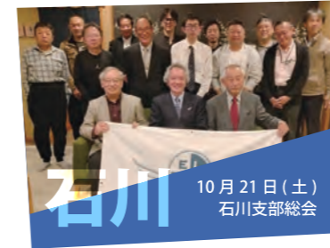
10月21日（土） 石川支部総会