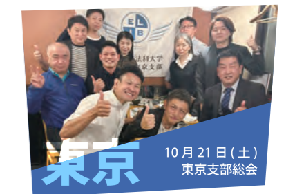
10月21日（土） 東京支部総会