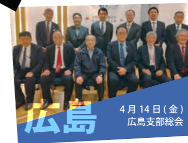
4月14日（金） 広島支部総会