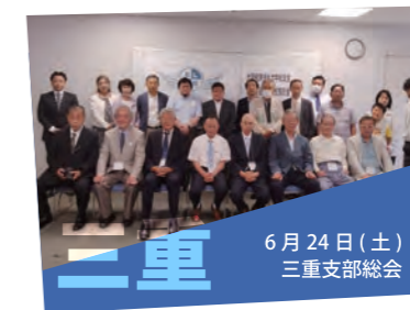
6月24日（土） 三重支部総会