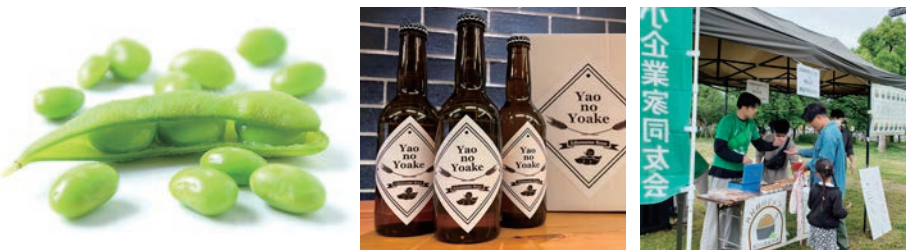
八尾市の特産品「八尾えだまめ」を使った新商品の開発に、地域と学生が一体となって取り組んでいます。