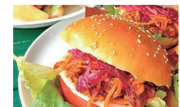
ベーカリー「NEWLY BORN」のパン。

「経法大生にもっとパンを買ってほしい」と考える大学近くのベーカリー「NEWLY BORN」に、学生がSNSを活用した販売プラットフォームを提案しました。