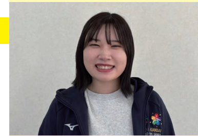
Y.I.さん 2024年入社 東大阪市役所 生活支援部中福祉事務所 事務・係員 経済学部 経済学科 2024年卒業