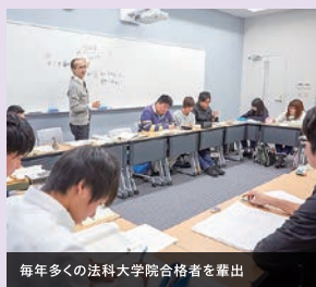
毎年多くの法科大学院合格者を輩出

法科大学院の合格をめざす徹底した少人数演習。 法律のプロをめざす上で必要な憲法・民法・刑法の高度な知識を身に付ける本学独自の特別演習。実践的な指導を通じて、法科大学院に合格するための知識や論点発見力も養い、論文式答案にも取り組みます。