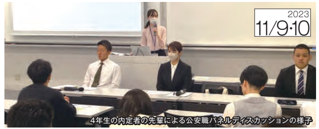
4年生の内定者の先輩による公安職パネルディスカッションの様子

4年生の内定者の先輩から、公務員採用試験の受験に際し、工夫した点や、面接での質問事例等について、公務員志望学生が参考となるポイントについてお話いただきました。セミナー中は熱心に先輩方の話を聞き、積極的に質問する在学生の姿がありました。また、昨年は参加者側にいた4年生の内定者の先輩が、後輩からの質問に堂々と答えていたため、誇らしさを感じるディスカッションとなりました。